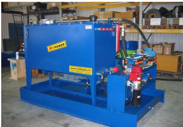
KITPOWER KPS 140-240-75-600FE